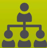
Sistema de pool de explotación

Fideicomiso NEU AÑELO se encargará del alquiler, mantenimiento, limpieza y lavandería de las unidades funcionales, liberando al propietario/inversor de toda tarea relacionada con su uf.